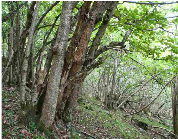
Frå hasselskogen under Rangåfjellet. På hasselstammen ser du Phellinus ferruginosus – Rustkjuka.