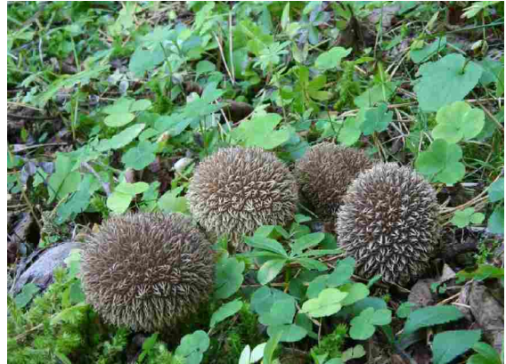
Lycoperdon echinatum -Piggsvinrøysopp. VU på raudlista.

UNDER RANGÅFJELLET er ein funnstad sentralt i eit samanhengande økologisk område på austsida av elva Aura. J6-05 har sett namnet Tyvika-Litjvatnet på heile området. Det er muleg å dele opp lokaliteten i bestand, men det er ikkje gjort hittil. Hovudnaturtypen er "Skog, kulturlandskap, rasmark, berg og kantkratt". Meir spesifisert: Rik edellauvskog, gammal edellauvskog, gråor-heggeskog, høgstaudebjørkeskog, skogsbeite, sørvendt berg- og rasmark, kantkratt. I det området det her er tale om, området sør for skytebanen, er det ein stor hasselskog med mykje innslag av alm og furu, men også selje, osp og hegg. På hjellane ned mot elva er det mukje gråor og planta gran. Det hittil nemnde området er beitemark og. Lenger opp blir det meir bjørk, og lenger sør storsteinut, brattare mark med mykje nedfallstrevirke, særleg av gamal alm. J6-05 verdsett området til A(svært viktig) og finn det å vere ein svært interessant sopplokalitet. Det vert rekna opp mange artsfunn, og også denne gongen slo dette til: 16 av dei vel 30 raudlistartane vart også funne her.