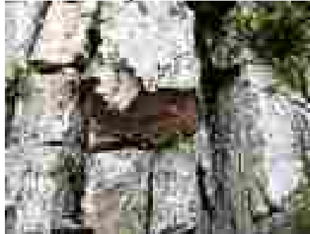
Hymenochaete ulmicola – ein ”ny” broddsopp på grov almebork, Funnen på Ljåstranda.