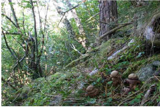
Geastrum triplex -Prestejordstjerne. VU på raudlista.