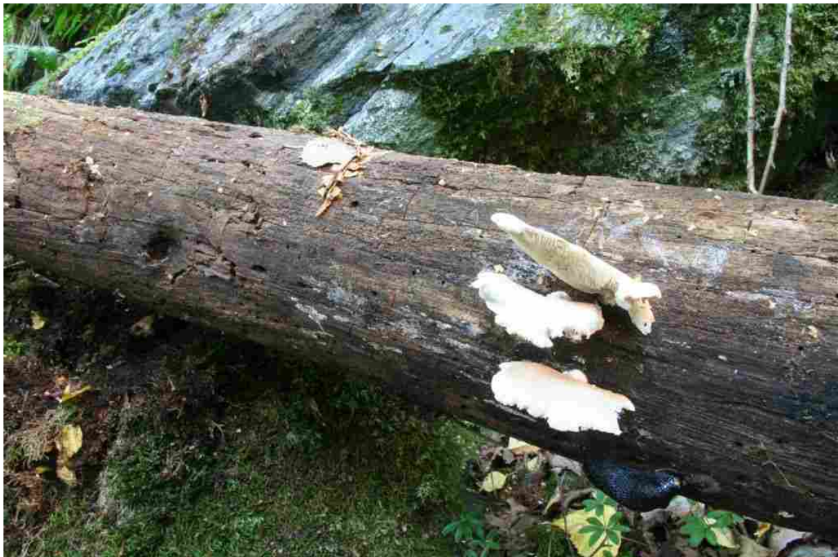
Glatt muslingsopp, Crepidotus applanatus , er ganske utbreidd på læger av osp i liene i heile Eikesdalen. Foto: Tom Hellig Hofton.

Mellom Fagerhjellen og lokaliteten ”Under Rangåfjellet” , ned mot Aura, men på vestsida, ligg skyttarhuset og ei gardssag. Dette området er elles prega av gamal slåttemark og noverande beitemark, av blandingsskog og til dels våtlendt mark. Også her vart det gjort spesielle funn i år.