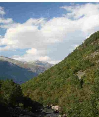
Utsikt frå skytebanen under Rangåfjellet mot Eikesdalsvatnet.

UNDER RANGÅFJELLET er ein funnstad sentralt i eit samanhengande økologisk område på austsida av elva Aura. J6-05 har sett namnet Tyvika-Litjvatnet på heile området. Det er muleg å dele opp lokaliteten i bestand, men det er ikkje gjort hittil. Hovudnaturtypen er "Skog, kulturlandskap, rasmark, berg og kantkratt". Meir spesifisert: Rik edellauvskog, gammal edellauvskog, gråor-heggeskog, høgstaudebjørkeskog, skogsbeite, sørvendt berg- og rasmark, kantkratt. I det området det her er tale om, området sør for skytebanen, er det ein stor hasselskog med mykje innslag av alm og furu, men også selje, osp og hegg. På hjellane ned mot elva er det mukje gråor og planta gran. Det hittil nemnde området er beitemark og. Lenger opp blir det meir bjørk, og lenger sør storsteinut, brattare mark med mykje nedfallstrevirke, særleg av gamal alm. J6-05 verdsett området til A(svært viktig) og finn det å vere ein svært interessant sopplokalitet. Det vert rekna opp mange artsfunn, og også denne gongen slo dette til: 16 av dei vel 30 raudlistartane vart også funne her.