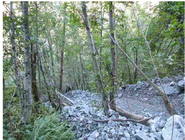
Dei bratte liene i Eikesdalen er utsett for mange slags ras. Det er ikkje rart her er mykje daud ved.