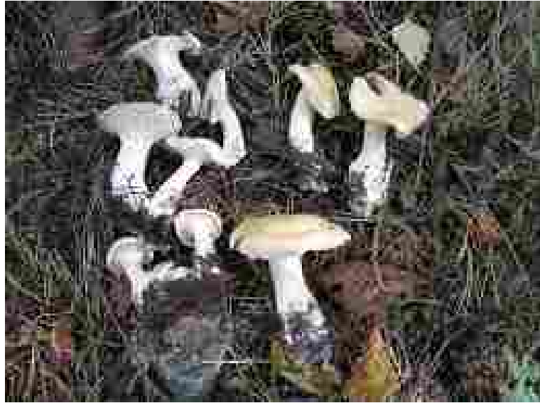
Leucopaxillus paradoxus har no to funnstader i Eikesdal. Desse er frå Ljåstranda.

Hovudnaturtypen her er ”Skog, rasmark, berg og kantkratt, kulturlandskap”. Meir spesifisert: Rik edellauvskog, sørvendt berg og rasmark, gammal edellauvskog, hagemark. Almeskogen, med mykje styva alm, dominerer i den sentrale delen, med innslag av rogn, dunbjørk, hassel, gråor, hegg og hengjebjørk. Økologien er og karakterisert som blanding av alm- lindeskog og gråor- almeskog. Det er svært frodig i området, verdsett til verneverdi A (svært viktig).