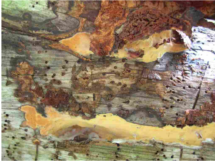
Hapalopilus salmonicolor- Laksekjuka på ein grov, gammal furulåg.