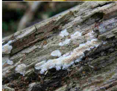
Dentipellis fragilis -Piggskorpe.

Med DIGERURA OG HESTNESET er vi komne over på vestsida av Aura. Det er ikkje notert mange funn herifrå denne gongen, for det var ikkje prioriterte område. Nokre få funn er